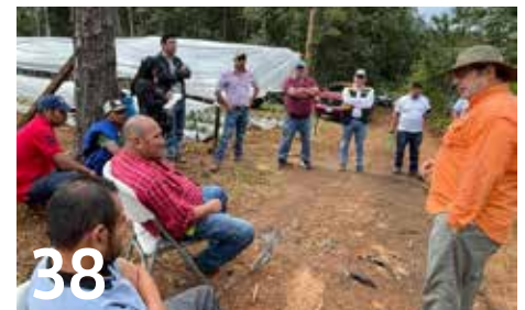
38 PRODUCTORES DE INTIBUCÁ APRENDEN A USAR DRONES