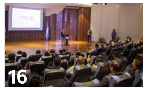
16 LANZAN ESPACIO DE FORMACIÓN EN LA UNAH