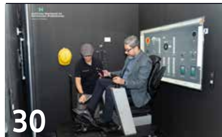
30 PARQUES TECNOLÓGICOS DIGITALES DE SIMULACIÓN UN ÉXITO EN INFOP