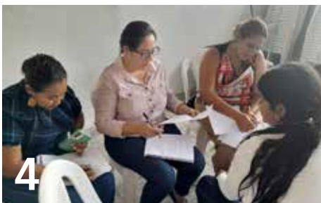
4 BRINDAN SEGUIMIENTO Y ACOMPAÑAMIENTO TÉCNICO EN ACTUALIZACIÓN CURRICULAR