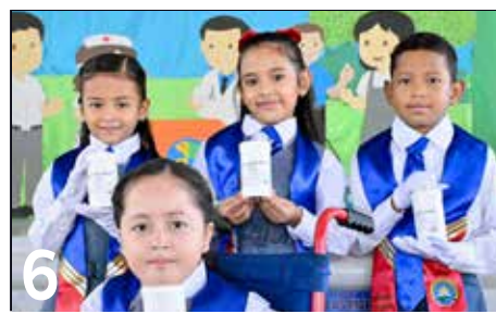
6 REALIZAN CAMPAÑA DE DESPARASITACIÓN DE EDUCANDOS 2025