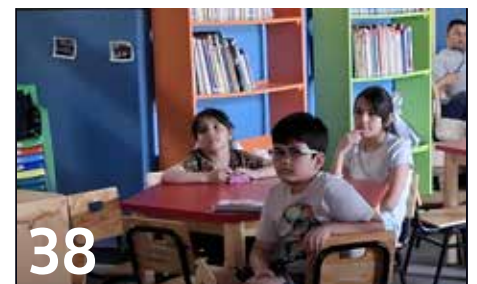
38 SE REALIZA TALLER DE CINE INFANTIL