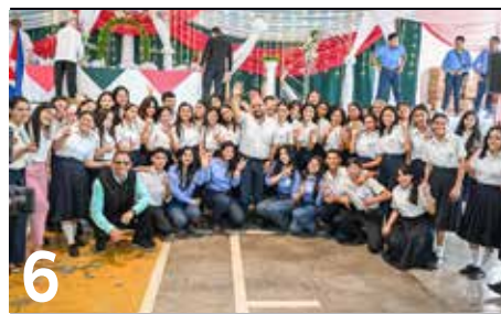
6 ENTREGAN COMPUTADORAS A LA ESCUELA NORMAL BILINGÜE ESPAÑA