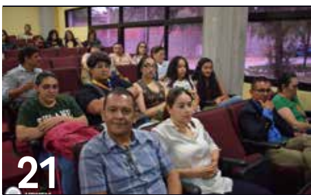
21 LANZAN PÁGINA DIGITAL DEL OUDENI DE LA UPNFM