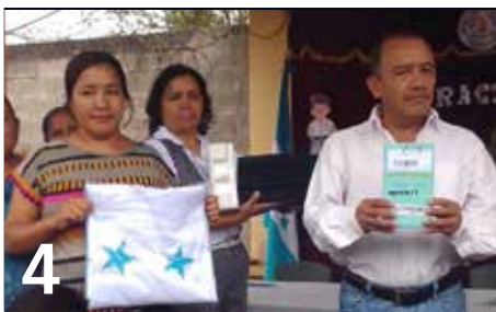
4 TECNOLOGÍA QUE TRANSFORMA LA EDUCACIÓN PARA CENTRO EDUCATIVO DE MATEO