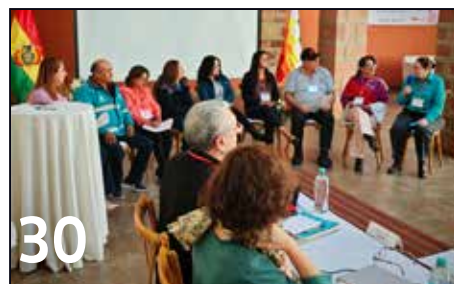
30 CONEANFO DA A CONOCER EL ALCANCE DE ENCUENTRO